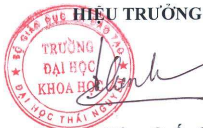
PGS.TS. Nông Quốc Chinh